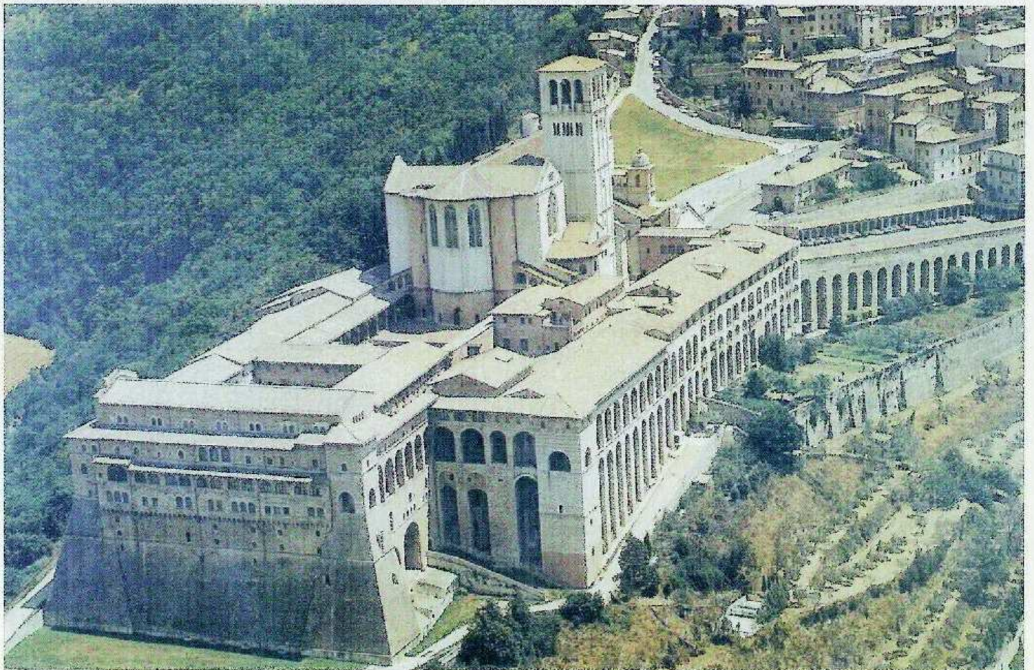
Sacro Convento di S. Francesco - Assisi

R RESINPROGET ® SRL CONSOLIDAMENTI E RESTAURI