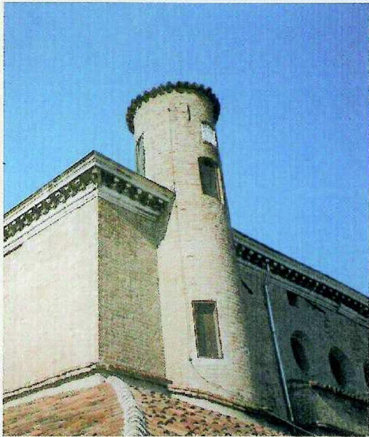
Palazzo Vescovic - Padova